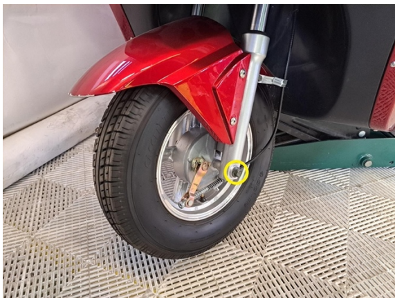
Irrota etuakseli (kiintoavain 14 mm) vastamutteri. (kiintoavain 17 mm).