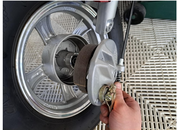
Ota jarrukilpi pois.