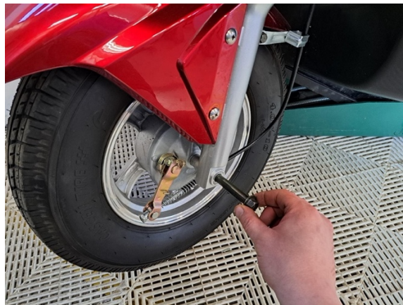
Vedä etuakseli pois ja laske etupyörä alas.