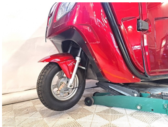
Nosta Autokruiserin etuosa ilmaan. (tunkki).