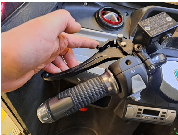
Kytke seisontajarru päälle.