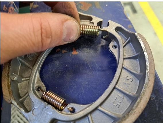
Ota jouset pois.