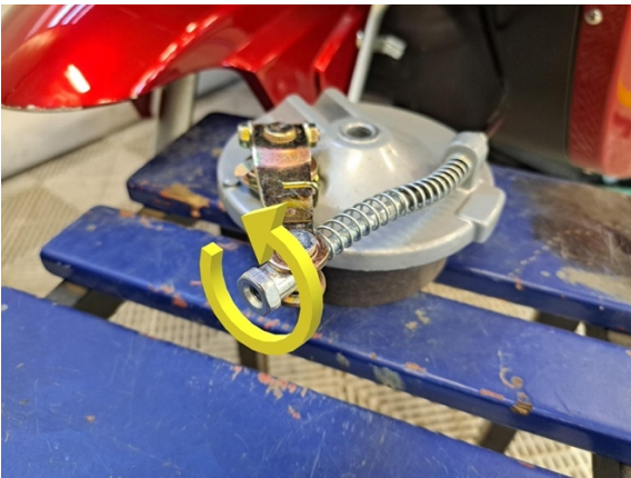
Löysää etujarruvaijerin säätömutteri löysimmilleen. (kiintoavain 14 mm).