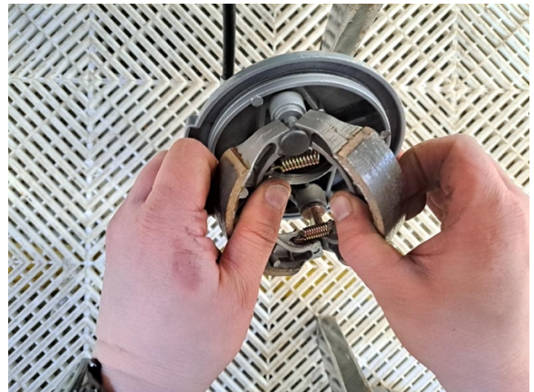
Ota jarrukengät pois.