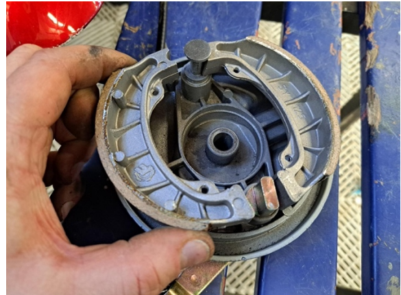
Asenna uudet jarrukengät paikoilleen.